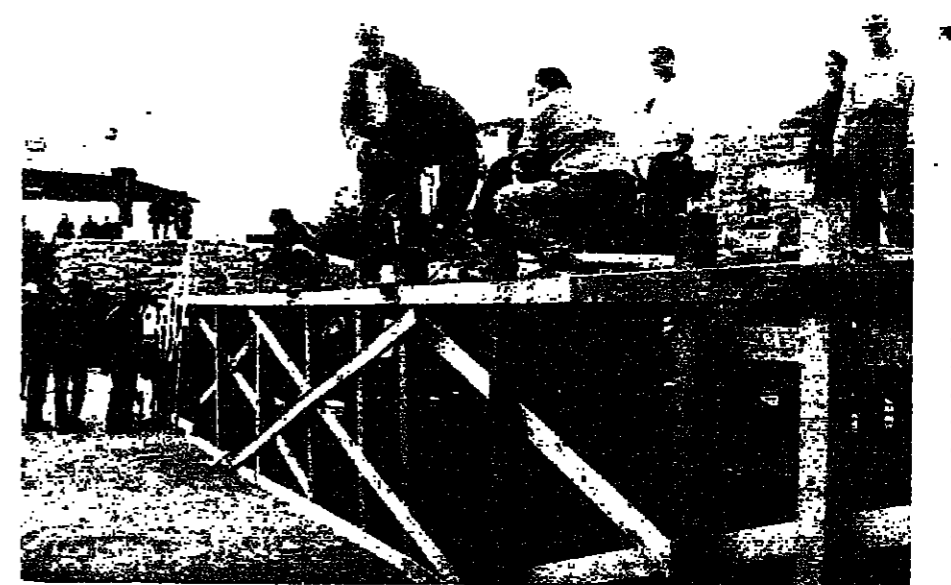
القامة سرح عند مدخل القصر